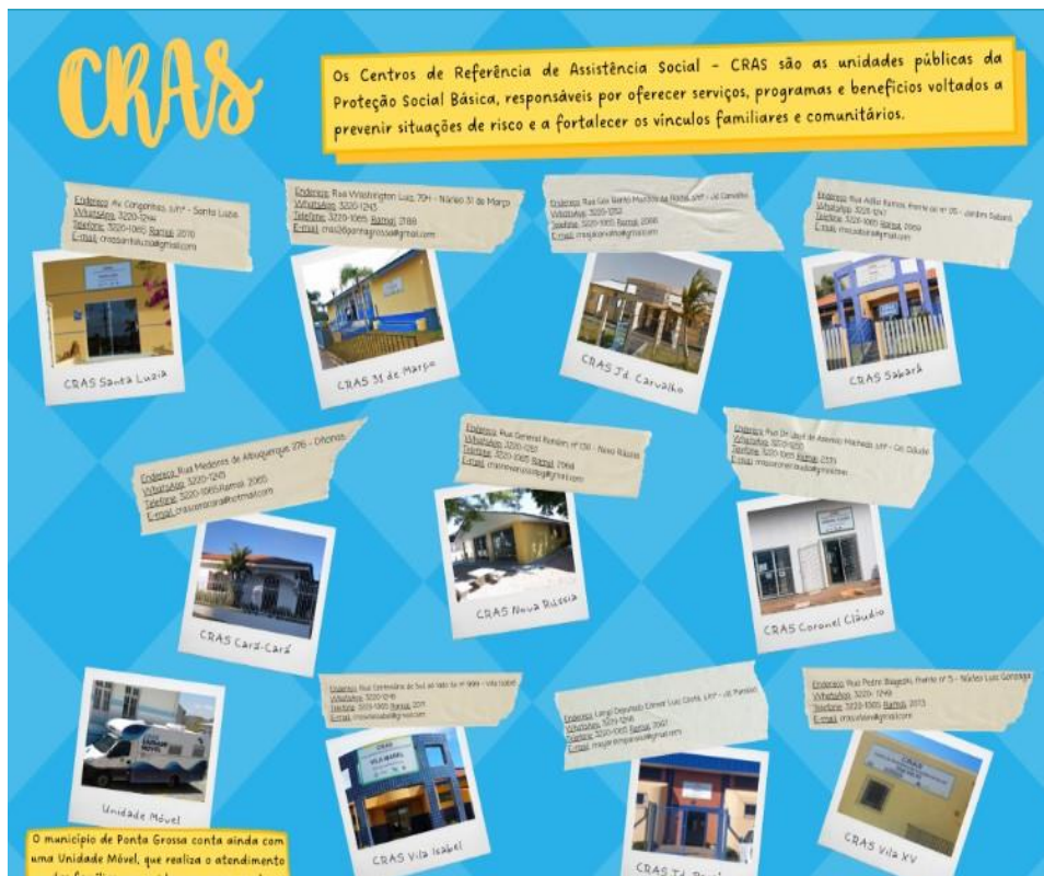
Figura 1 – Centros de Referência de Assistência Social do município de Ponta Grossa - 2022