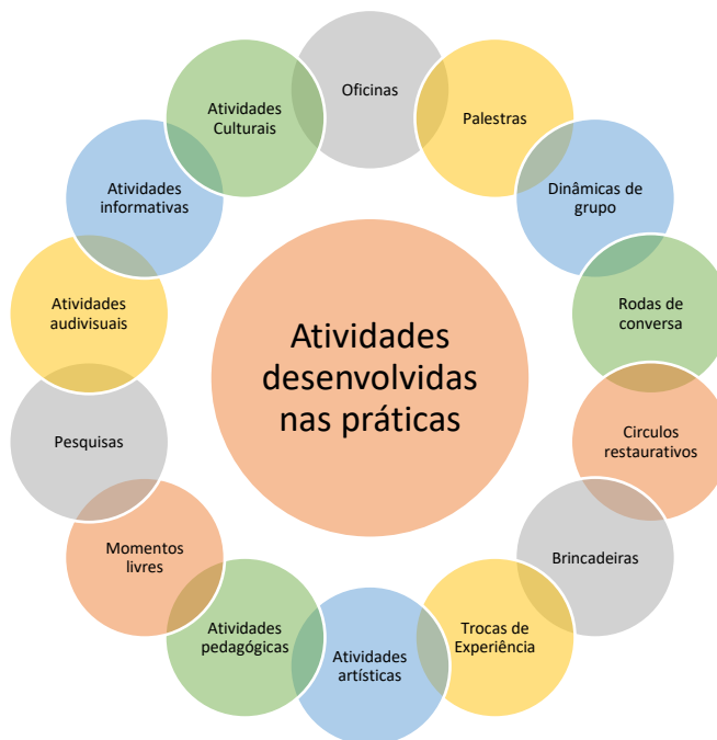
Figura 5 – Atividades desenvolvidas nas prática pesquisadas no âmbito dos SCFVs e dos PAIFs – Ponta Grossa - 2022.

Quanto às atividades desenvolvidas no âmbito das práticas pesquisadas na figura a seguir podemos constatar a diversidade delas.