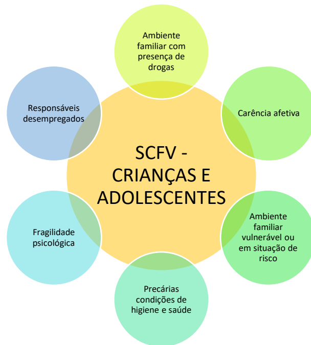
Figura 5 – Principais demandas das crianças e adolescentes que acessam às práticas pesquisadas no âmbito dos SCFVs para crianças e adolescentes – Ponta Grossa - 2022.