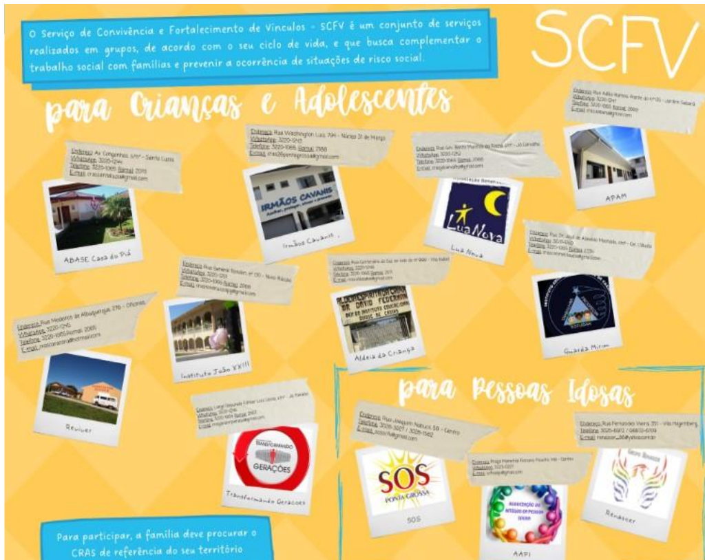
Figura 2 – Serviços de Convivência e Fortalecimento de Vínculos do município de Ponta Grossa