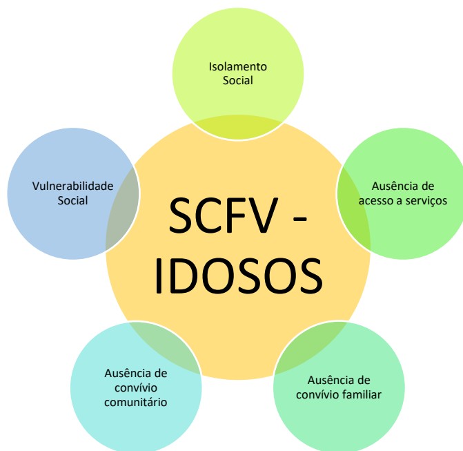
Figura 4 - Principais demandas das pessoas idosas que acessam às práticas no âmbito dos SCFVs para idosos – Ponta Grossa - 2022.