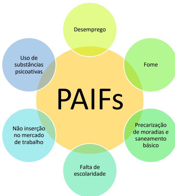
Figura 3 – Principais demandas das famílias que acessam às práticas desenvolvidas no âmbito do PAIF – Ponta Grossa - 2022.