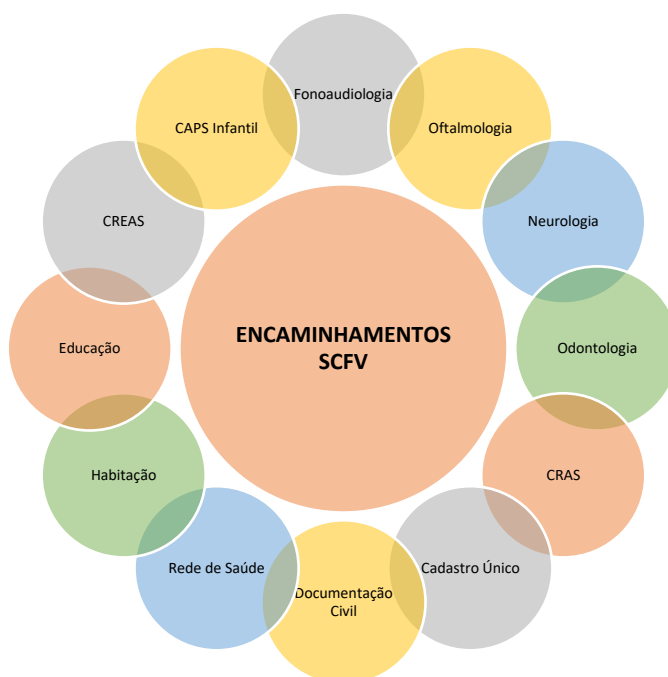
Figura 7 – Principais Encaminhamentos realizados pelas práticas desenvolvidas no âmbito dos SCFV – Ponta Grossa – 2022